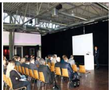
Fachtagung der WHS/GMA in vollem Gange GMA