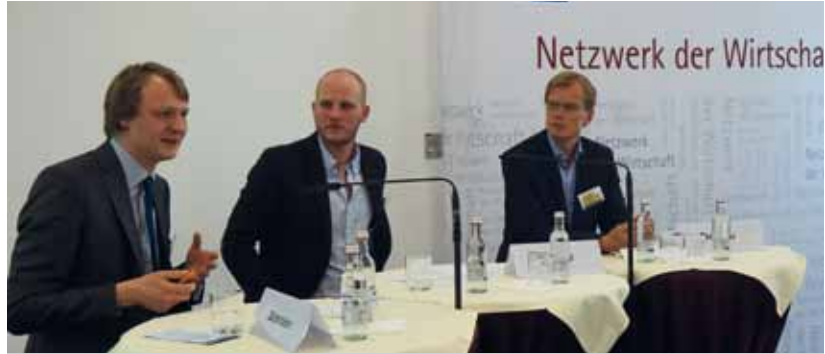
Podiumsgespräche: Zukunft von Gastronomie und stationärem Handel