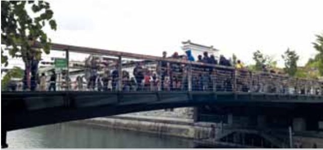
Fleischerbrücke in Ljubljana