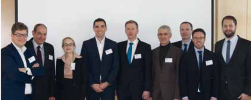
Referenten und Organisatoren der erfolgreichen Veranstaltung in Schweinfurt