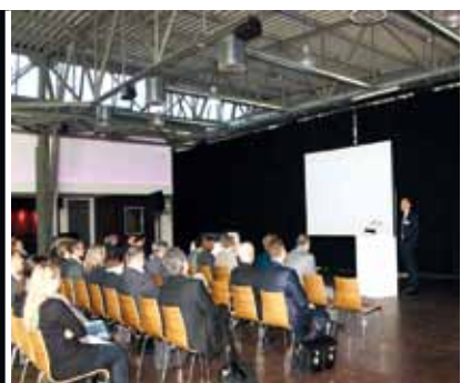
Fachtagung der WHS/GMA in vollem Gange GMA