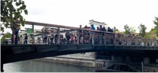
Fleischerbrücke in Ljubljana