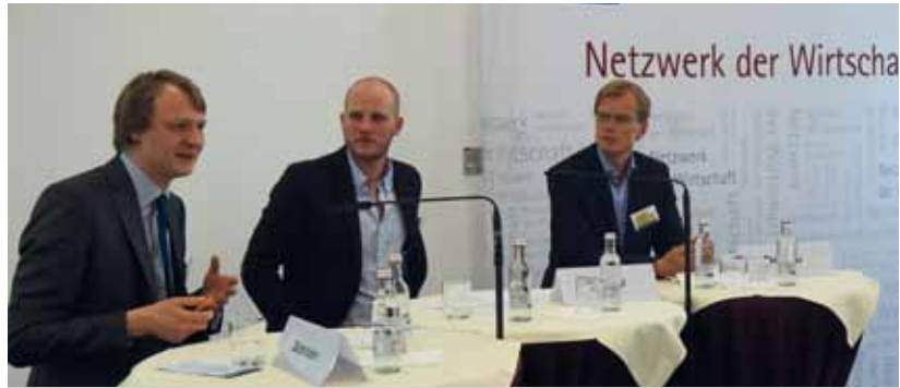
Podiumsgespräche: Zukunft von Gastronomie und stationärem Handel