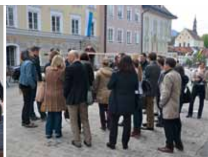
Anschließend Stadtrundgang zu Strukturwandel und -entwicklungen in Bad Tölz GMA