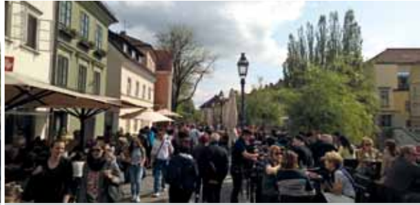
Die Promenade an der Ljubljana