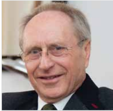
Prof. Dr.-Ing. Günter Sabow

Auch hinsichtlich der Städtebauförderung wird auf Klimaschutz gesetzt: Der aktuelle Förderschwerpunkt konzentriert sich auf die ganzheitliche ökologische Erneuerung mit den vordringlichen Handlungsfeldern Energieeffizienz im Altbaubestand, Verbesserung des Stadtklimas, Reduzierung von Lärm und Abgasen und Aktivierung von Naturkreisläufen. Ein verkehrspolitischer Schwerpunkt wird in der Förderung des Radverkehrs gesehen, denn Fahrradverkehr macht keinen Lärm, keine Abgase, keinen Stau. Deshalb bringen fahrradfreundliche Städte ein Plus an Lebensqualität, wie entsprechende Rankings zeigen. Zudem kann in der Radverkehrsförderung mit vergleichsweise geringen finanziellen Mitteln viel erreicht werden. So konnte die Stadt Karlsruhe ihren Radverkehrsanteil am Modal Split innerhalb von nur 10 Jahren von 16 auf 25% steigern.