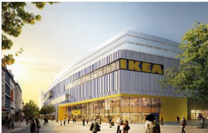
Abb. 4: IKEA Hamburg-Altona

Von der schwierigen Standortsuche für IKEA berichtete Johannes Ferber , Geschäftsführer der IKEA Verwaltungs-GmbH. Zu den 46 in Deutschland bestehenden Einrichtungshäusern sollen nach Wünschen von IKEA bis zum Jahr 2020 weitere 20 hinzukommen. Stellt sich allein die Frage, wo. Denn mit dem „Rastatt-Urteil“ (wir berichteten im InfoDienst Oktober 2012) war klar: Zumindest in Baden-Württemberg ist die Ansiedlung eines IKEA-Hauses im üblichen Flächen- und Sortimentslayout ausschließlich in Oberzentren – und dort nur in integrierter Lage – genehmigungsfähig. Mit diesen Maßgaben geeignete Flächen zu finden, stellt