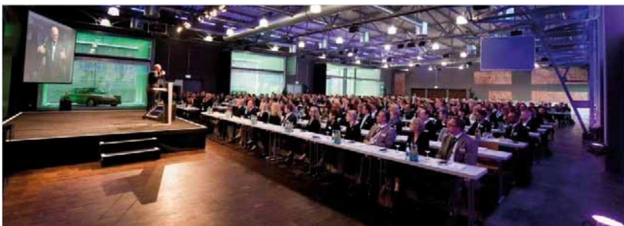
Abb. 4: Veranstaltungsräumlichkeiten

Im November 2011 wurde das Meilenwerk Region Stuttgart mit dem Immobilien Award der Metropolregion Stuttgart ausgezeichnet: „Das Projekt zeige, wie mit Mut und Visionskraft eines privaten Investors eine Branche wieder mit pulsierendem Leben gefüllt werden könne und sich zum Frequenzbringer eines ganzen Stadtteils entwickle.“