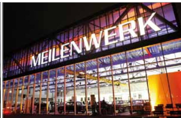
Abb. 2: Hangar und Wertgebäude im Originalzustand und heute