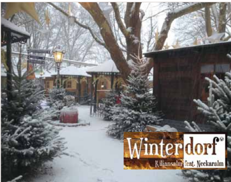
Abb. 2: Besinnlichkeit und Party im Winterdorf

nehmen. Dass die Filialisierung längst auch den Gastronomiesektor erreicht hat, zeigt sich eindrücklich am Beispiel Heilbronn: In den kommenden zwei Jahren sollen 3.100 m 2 an neuer Gastronomie entstehen, wobei ca. 90 % der Neuansiedlungen Ketten sind. Nun gilt es verstärkt, der lokalen Gastronomie Aufmerksamkeit zu zollen, denn Heilbronn soll nicht den Weg des Handels gehen, der in den Großstädten durch uniforme Angebote von Filialisten zunehmend austauschbar wird.