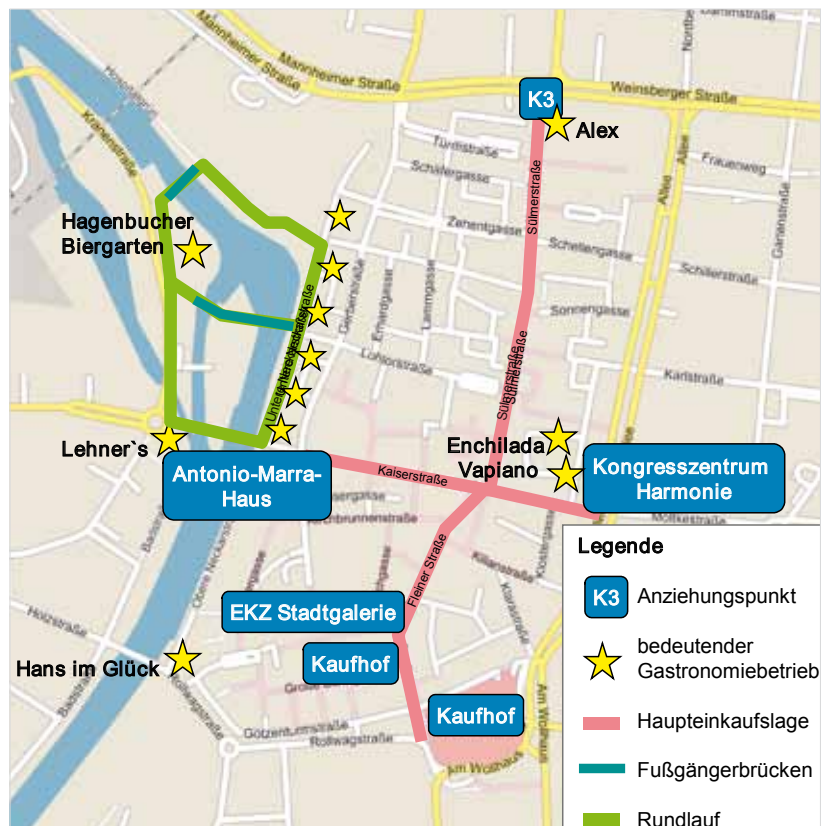
Karte 1: Innenstadt Heilbronn

Quelle: Nelly Roth/GMA; Kartengrundlage: Regiograph 2012