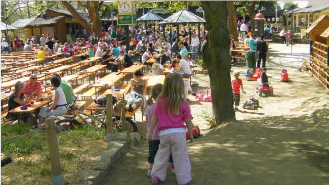
Abb. 1: Kindern wird im Food Court nicht langweilig