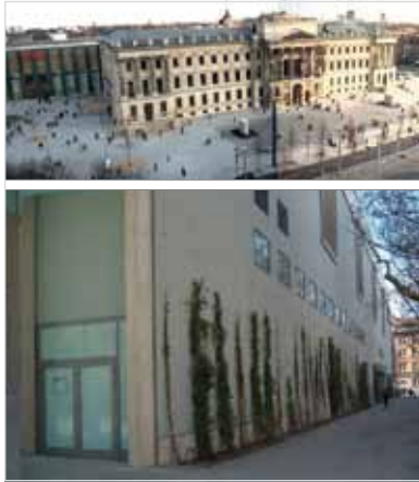
Abb. 2: Schloss-Arkaden Braunschweig – pompöse Front, geschlossene Rückseite

nenstadt-Handel unterliegt ebenfalls bedeutenden Veränderungen. Nach Jahrzehnten der Suburbanisierung ist mit der Shopping-Mall der großflächige Handel in die Stadt zurückgekehrt und besetzt brach gefallene Grundstücke am Rand der Innenstädte – Bahnflächen, Brauereigelände, Infrastrukturflächen. Die sperrigen Immobilien nähren jedoch Zweifel, dass damit viel erreicht sei. Auch wird sich zeigen, ob die Shopping-Center der wachsenden Konkurrenz durch den Online-Handel standhalten können.