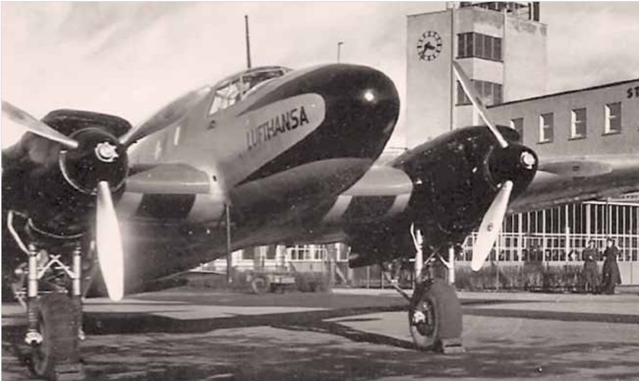
Abb. 1: Lufthansa-Maschine auf dem Landesflughafen