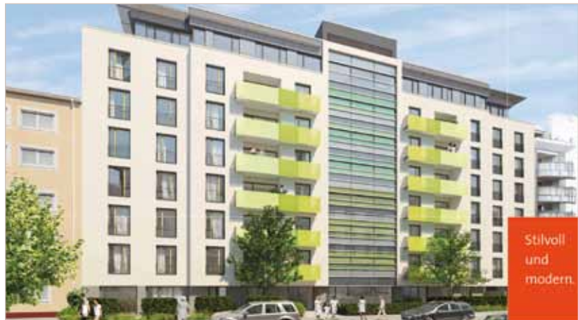
Abb. 3: Umnutzung von Büro- zu Wohnräumen in Frankfurt, Kölner Straße

ving lautet die Lösung, ein offenes, flexibles Wohnkonzept, das nicht in Räumen, sondern in Zonen denkt. These 3: „Wohnen wird intelligent durch mehr Automatisierung/IT/Haustechnik.“ Es sind heute bereits ausgefeilte Systeme zur automatischen Steuerung der Haustechnik auf dem Markt, doch wird es wohl noch einige Zeit dauern, bis diese zum Standard im Hausbau werden. These 4: „Baumaterialien: Zurück in die Zukunft!“ Nachdem die energetische Sanierung in Form einer Wärmedämmung mit den typischen Styropor-Dämmplatten erste Schwachstellen offenbart (schlechtes Raumklima, ungeklärte Entsorgung, „Gesichtsverlust“ von Altbau-Fassaden), ist eine Rückbesinnung auf natürliche Materialien