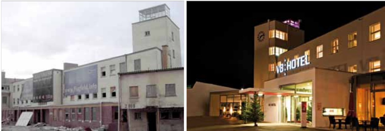
Abb. 3: Ehemaliges Terminalgebäude, heute V8-Hotel